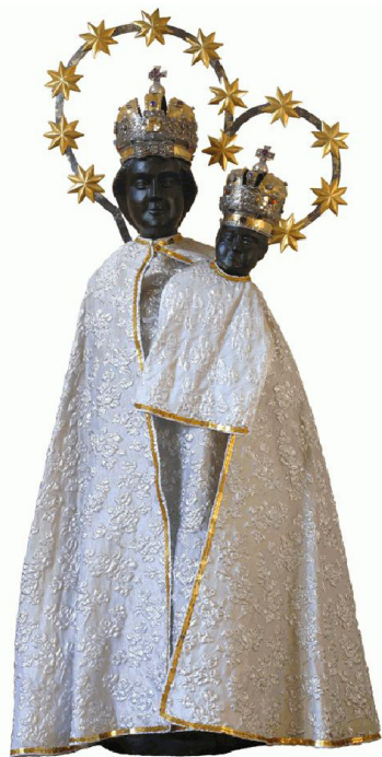
Majka Božja Bistrička 13. srpnja